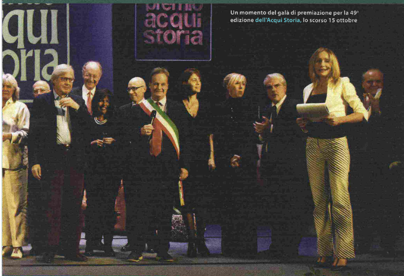
Un momento del galà di premiazione per la 49ª edizione dell'Acqui Storia, lo scorso 15 ottobre

premio conferito a George L. Mosse nel 1975 per il suo «La nazionalizzazione delle masse»). Nel 1984 nasce il premio «Testimone del Tempo», destinato a personalità di rilievo nella società contemporanea. I nomi dei primi «Testimoni» però non lasciano dubbi circa l'humus culturale e politico in cui questo riconoscimento veniva concesso: Bobbio, Spadolini, Spinelli, Andreotti, Pajetta... «Per quanto nomi prestigiosi erano tutti legati a un milieu politico-culturale e accademico e sociale ben preciso»